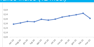
Grafico indice (12 mesi)