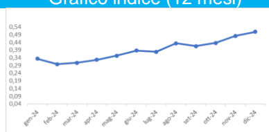
Grafico indice (12 mesi)