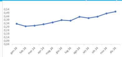
Grafico indice (12 mesi)