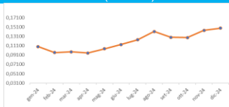
Grafico indice (12 mesi)

Totale (1 + \lambda) * (\text{PUN Index GME} + 0,0182) + 0,023 * \lambda = \text{perdite di rete}