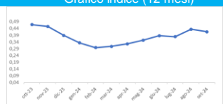
Grafico indice (12 mesi)