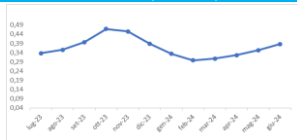
Grafico indice (12 mesi)