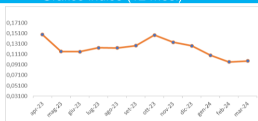
Grafico indice (12 mesi)

Totale (1 + \lambda) * (PUN + 0,0182) + 0,0138 * \lambda = \text{perdite di rete}